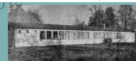
Dit is het oude dorpshuis 'Het Trempunt' dat in 1974 werd vervangen door het huidige dorpshuis 'De Snikke'.

In 1236 is er een kerkje gebouwd in Oud Avereest. Dat betekent dat er in die tijd wel een vijftientig boerderijtjes moeten hebben gestaan, aan beide zijden van de Reest. Want ook aan de Drentse kant gingen ze te kerk in Oud Avereest vanuit Luttenberg tot aan De Stapel. Avereest, vroeger Overeest, behoorde bij Zuidwolde, de grens lag in de venen bij Witharen. Vanuit Ommen liep er een weg langs de Ommerschans, over de Balkbrug. De balkbrug was een balk over de bodem van de Dedemsvaart. De schepen mochten niet te zwaar beladen zijn, anders zouden ze vastlopen op de balk.